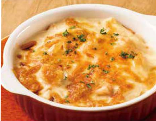
継承 ドリリア定食 先代からの継承メニュー 文明開化の味 1150円(税込)