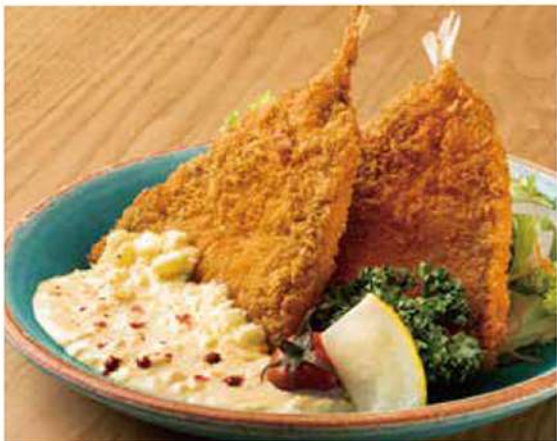
極み 鱈フライ定食 日本橋名物 べったら漬けたタルソースで 1200円(税込)