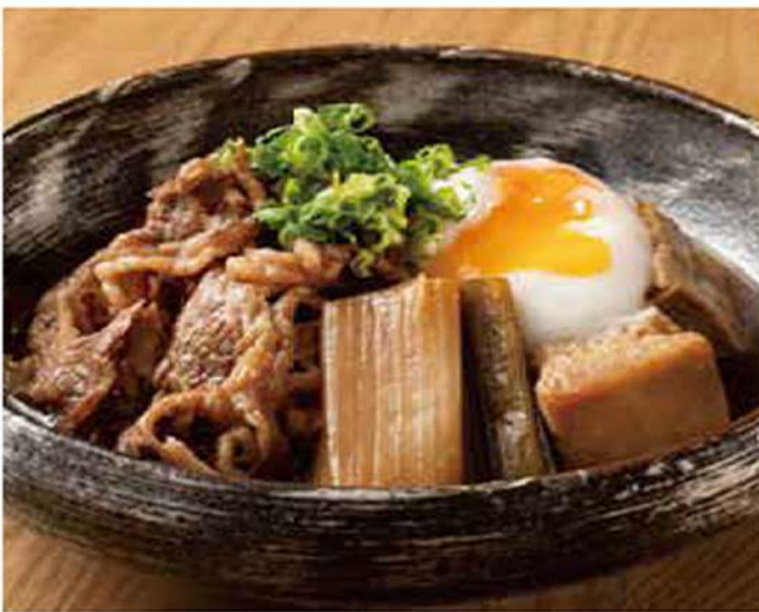
継承 牛すき焼き定食 昭和かずさやから続く 伝統の割りりしたで 1100円(税込)