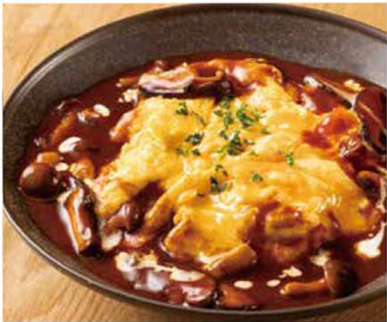
秘伝 オムレツライス定食 ほろ辛いデミグラスソースに キノコをふんだんに 1000円(税込)