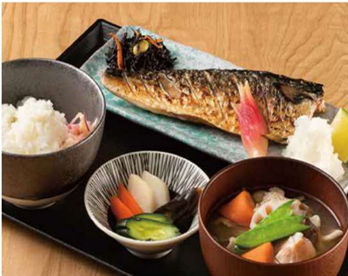
↑ 鯖の塩焼き定食 ミネラルたっぷり淡路島藻塩で仕上げた 滋味深い魚の味わいをお楽しみください 1000円(税込)